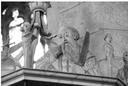
Brustbild des Propheten Jesaja auf dem Gesims des Schalldeckels

Doch hier soll es um das theologische Programm gehen. Es ist dadurch gekennzeichnet, dass alle Bilder und Texte so aufeinander abgestimmt sind, dass ein geschlossener theologischer Gedankenzusammenhang entsteht. Um ihn voll zu erfassen, ist es nötig, die Bibelstellen zu lesen. Das ist heute jedoch nicht für jedermann möglich, da die Schöpfer der Kanzel die lateinische Bibelübersetzung, genannt Vulgata, benutzten. Der Bildschmuck verteilt sich auf Kanzelbrüstung, Brüstung und Unterseite der Treppe sowie den Schalldeckel.