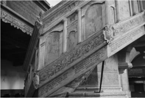
Mittelteil der architektonisch gegliederten Treppenbrüstung mit alttestamentarischen Darstellungen nach 1. Mose 18 (links) und Jesaja 11 (rechts), dazwischen Allegorie der Gerechtigkeit

An der Treppenbrüstung hat der Künstler in schmalen Bildfeldern zwischen biblischen Szenen die durch Bibelsprüche interpretierten Tugendallegorien der Tapferkeit, Geduld, Gerechtigkeit sowie des Glaubens und der Hoffnung eingefügt.