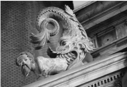
Der Prophet Jona zwischen den Zähnen des Walfisches auf dem Gesims der Treppenbrüstung

Dass der Prediger dem göttlichen Auftrag gemäß ohne Rücksicht auf die eigene oder eine andere Person zu verkündigen hat und dabei auch den Beistand Gottes erfahren wird, ist mit dem Jona zwischen den Zähnen des Walfisches (am oberen Ende der Treppenbrüstung) und dem Daniel in der Löwengrube, der von dem durch einen Engel aus Judäa herbeigebrachten Habakuk gespeist wird (Malerei unter der Kanzeltreppe) gemeint. Die Darstellung folgt Daniel 6, 17-25 mit dem Zusatz aus der Vulgata Kapitel 14, 33-39.