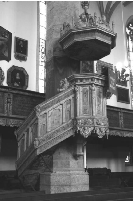
Kanzel in der Hauptkirche St. Marien von Nordosten

Zu den bedeutenden Kunstwerken, die die spätgotische Hauptkirche St. Marien in Kamenz aufweist, gehört auch die Kanzel. Sie ist ein wertvolles bildkünstlerisches Zeugnis der Reformation in der Oberlausitz.