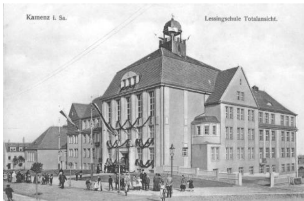
Lessingschule 1910 (SSK LM 1115 II Ak)

Gästerverzeichnis zur Feier der Einweihung des städtischen Realschulgebäudes am 18. Oktober 1910, mittags 11.30 Uhr.