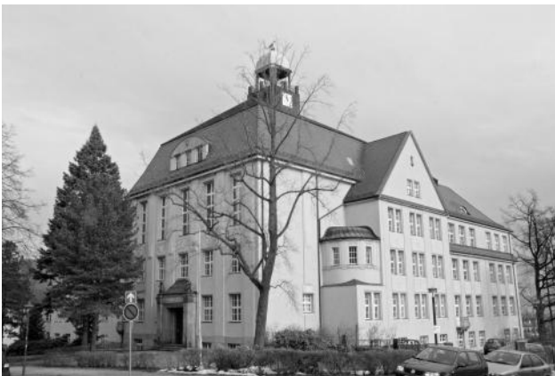
Lessingschule 2009

Übrigens: Der Titel der Ausstellung bezieht sich auf den letzten Vers aus dem „Wanderlied der Lessingschule“. Einige Lessingschüler erinnern sich vielleicht an den fünf Strophen umfassenden Text und an die dazugehörige Melodie. Im Hinblick auf die aktuelle Debatte um die Erhaltung der altehrwürdigen Schule bleibt zu wünschen, dass es auch nach weiteren 100 Jahren noch ehemalige Lessingschüler geben wird, die ihrer Schule gedenken können.