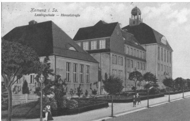
Blick auf die Lessingschule von der Oststraße (SSK LM 1487 II AK)